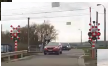
Screenshots gezien op RTL uit anonieme bron